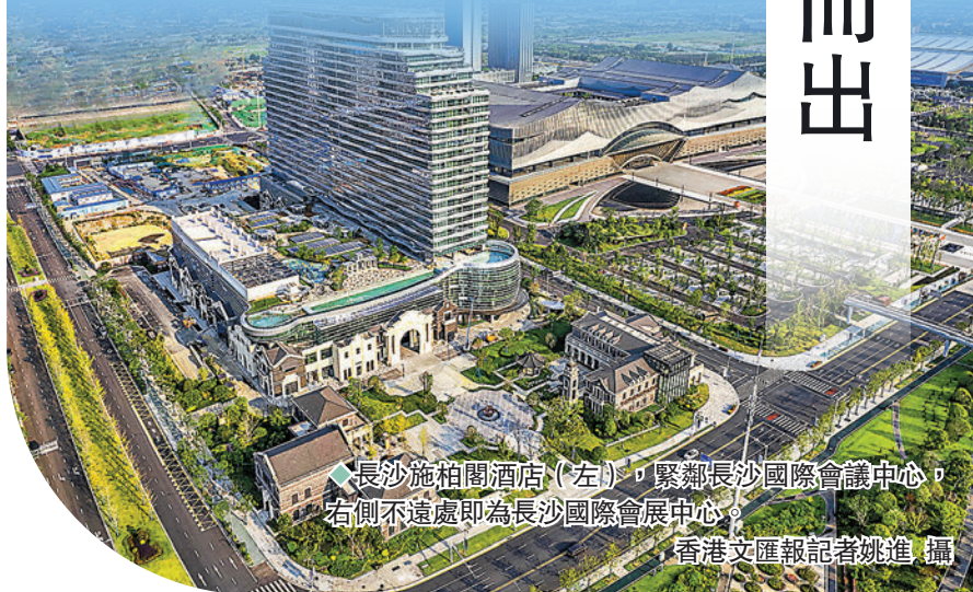
◆長沙施柏閣酒店(左)，緊鄰長沙國際會議中心，右側不遠處即為長沙國際會展中心。