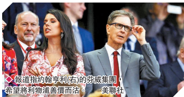
◆報道指約翰亨利(右)的芬威集團，希望將利物浦舊價而沽。

曼城日前英超夏蘭特補時的12碼絕殺富咸，各項賽事連贏第3場，今屆主場10戰10勝。相對於曼城在聯賽榜與阿仙奴可噓馬頭，新帥樸達上任後多場不敗蜜月期結束的車路士，日前0:1不敵阿仙奴遭逢英超兩連敗，需為重回聯賽榜前四苦戰。不僅近況，車路士門將阿列沙巴拿加，中堅科芬拿，兩閘列斯占士、芝維爾和中場簡迪仍養傷，可供輪換的板凳兵不多，翼鋒基甸普列錫和中場干拿加歷查是其中的選擇。曼城則有上仗沒踢正選的翼鋒馬列斯、中場菲爾科頓和中堅魯賓戴亞斯等球星可候命，以逸待勞下形勢更勝「車仔」。