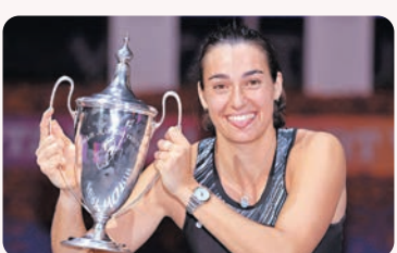
◆嘉西亞捧盃時刻。