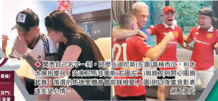
◆聞悉自己名字一刻，阿歷士迪尼斯(左圖)喜極而泣，和太太擁抱慶祝；安東尼馬菲奧斯(右圖左二)與親友則開心圍圈起舞；落選的馬德里體育會前鋒根夏(上圖)則以落寞背影表達失望心情。

至於名單公布對一些邊緣國腳來說更是一個悲喜交集的忐忑時刻，効力西維爾的左閘阿歷士迪尼斯知道自己入選後泣不成聲，李察利臣以及他的家人被讀到名字時表情由緊張到興奮的轉變，都證明了今屆世盃大軍席位爭奪的激烈程度，以及對這班頂級球星有多重要。