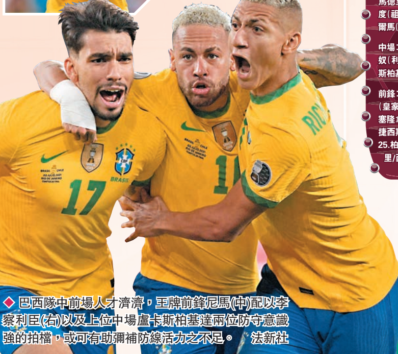
◆巴西隊中前場人才濟濟，王牌前鋒尼馬(中)配以李察利臣(右)以及上位中場盧卡斯柏基達兩位防守意識強的拍檔，或可有助彌補防線活力之不足。