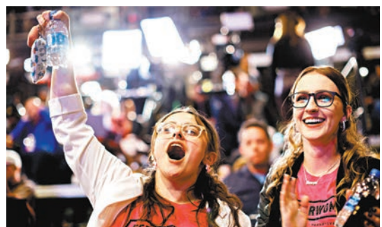
◆賓夕法尼亞州民主黨候選人費特曼勝出選舉，其支持者舉臂歡呼。

在選前顯得信心十足的眾議院共和黨領袖麥卡錫，儘管面對共和黨表現未如預期，但仍顯出樂觀態度，他昨日早上向支持者發表演說，表示「很明顯我們正奪回眾院」。然而身為特朗普親密盟友的共和黨眾議員格雷厄姆接受全國廣播公司(NBC)訪問時，承認共和黨「紅色浪潮」未有出現，但整體結果仍不俗。◆綜合報道