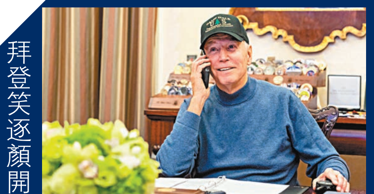
◆民主黨選前民調一直處於不利，但總統拜登昨日終於展現久違的笑容，更在社交媒體上載致電祝賀民主黨候選人當選的照片。