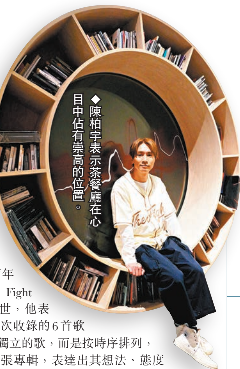
陳柏宇表示茶餐廳在心目中佔有崇高的位置。

陳柏宇最近推出新專輯,獲公司安排兩項宣傳大計,分別到日本進行音樂交流,以及在他心中佔有崇高地位的茶餐廳有合作,令他忽發奇想,幻想將來開一間融合舞台表演的茶餐廳,認真創新。 陳柏宇籌備了兩年的全新專輯《The Fight Goes On》最近面世,他表示有別於以往,今次收錄的6首歌曲,每一首都不是獨立的歌,而是按時序排列,以一個概念貫穿整張專輯,表達出其想法、態度和思維。其中《拖》曲就充滿了放下理智的浪漫,而《命盡頭》和《墜落》就代表了他理智的一面,道出生命中必然會經歷高低起伏,視乎如何處理與面對;「有邊個人會唔識得享受和開心,只係會唔識處理唔開心,如何由谷底爬出來才是重點。慶幸我本身思想正面和樂觀,即使遇上別人認為是難過或跌落谷底的事,對我而言不過是個過程,亦是我最自豪的心態,某程度上也是無敵的。」