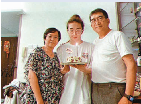
◆傷者阿Mo與父母感情深厚。