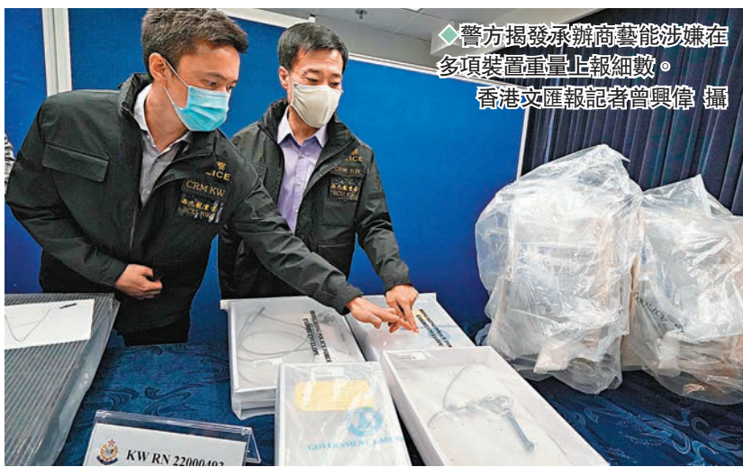
◆警方揭發承辦商藝能涉嫌在多個裝置重量上報細數。

對僱主沒為舞蹈員購買保險一事，他們認為目前有許多地方尚未清晰，而不同地方都有不同的保障條例，覺得香港在保障制度上尚未成熟，相信今次意外會令更多人關注到舞蹈員的保障。