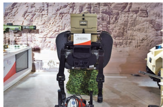
◆「嘯天-350」，暱稱「大牛」，自重350公斤，可以搭載150公斤貨物在邊境山地區域跟隨步兵巡邏，進行伴隨保障。