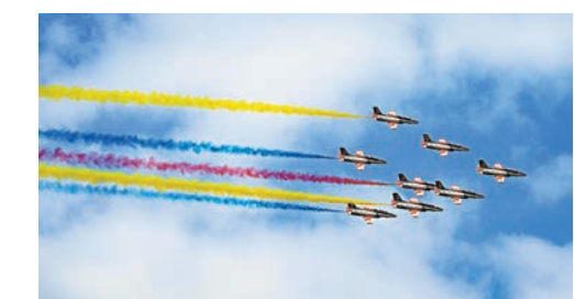
◆中國空軍航空大學「紅鷹」飛行表演隊選用空軍軍旗的紅、黃、藍三種顏色潑墨長空。

香港文匯報訊（記者 盧靜怡、帥誠、方俊明、黃寶儀 珠海報道）11月11日是人民空軍成立73周年紀念日。在中國（珠海）國際航空航展博覽會上，八一飛行表演隊、「紅鷹」飛行表演隊為空軍生日準備了特別驚喜。在拉煙設計上，空軍八一飛行表演隊選用空軍軍旗的紅、黃、藍三種顏色，以藍天為幕戰機作筆向人民空軍生日致敬。空軍航空大學「紅鷹」飛行表演隊所有機群隊形全部實施拉煙，在隊形編排上，以8機機群低空通場的空中最優禮節，表達對人民空軍最崇高的敬意。