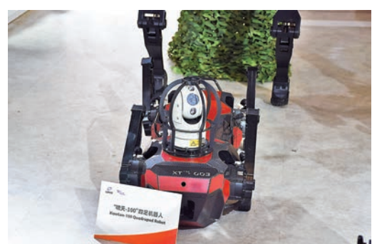
◆「嘯天-100『機械狗』」，自重50公斤，可以負重30公斤，通過切換不同武器，執行城區等特殊環境下的不同偵察或攻擊任務。