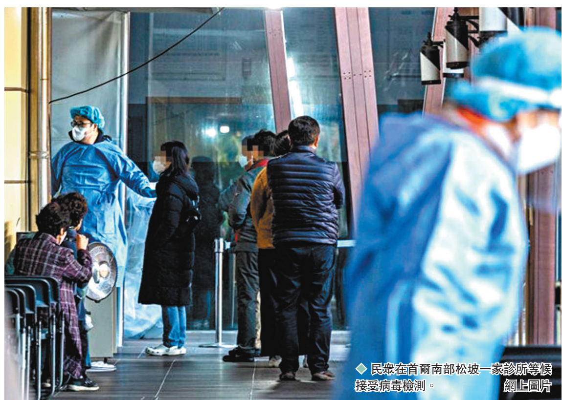
◆民眾在首爾南部松坡一家診所等候接受病毒檢測。