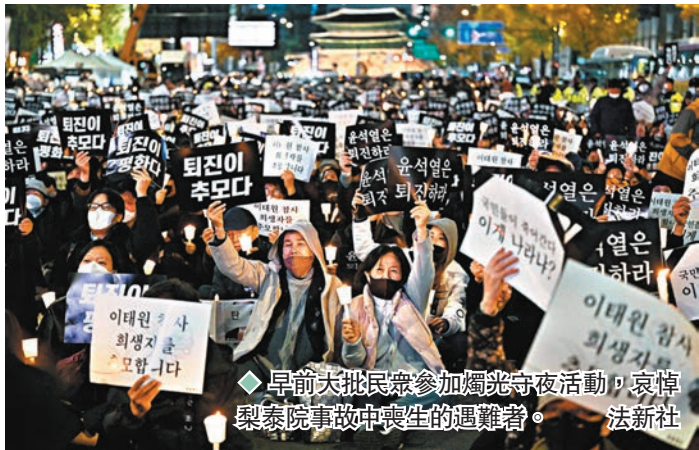
◆早前大批民眾參加燭光守夜活動，哀悼梨泰院事故中喪生的遇難者。

韓國首爾梨泰院上月底發生人踩人事故後，因涉嫌刪除警方內部關於「梨泰院聚集大規模人群容易引發安全事故」的警告文件，而接受調查的龍山區警察署情報科股長，被發現在家中死亡，初步懷疑是自殺身亡。