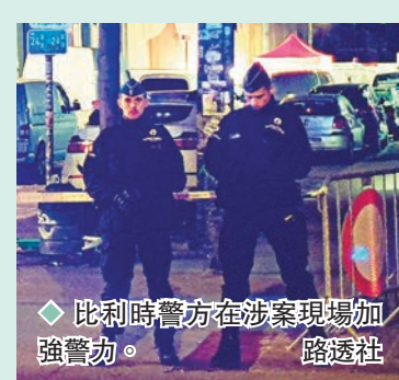
◆比利時警方在涉案現場加強警務。