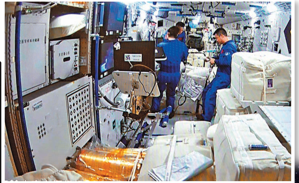
◆中國航天員首次在太空站迎接貨運飛船來訪。圖為天舟五號與太空站組合體對接後的天和核心艙內情況。