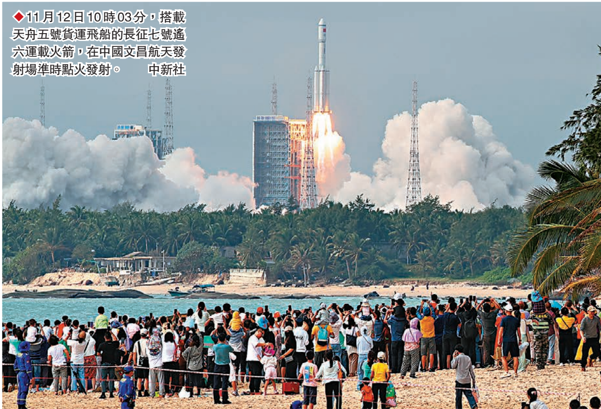
◆11月12日10時03分，搭載天舟五號貨運飛船的長征七號遙六運載火箭，在中國文昌航天發射場準時點火發射。

天舟五號完成與太空站組合體的交會對接，為「太空之家」送去新的物資補給。不久後神十五號載人飛船也將發射，將有3名航天员進駐中國太空站。屆時，神十五號將會對接在天和核心艙節點艙的前向對接口，也就是現在太空站組合體唯一一個空着的對接口。屆時，中國太空站將會形成「三大艙段」+「三艘飛船」的組合體，也就是天和核心艙、問天實驗艙、夢天實驗艙、天舟五號貨運飛船、神舟十四號、神舟十五號載人飛船同時在軌的，總重超過100噸。神十五號和神十四號兩個乘組也將實現「太空會師」，共同完成中國航天史上首次航天员乘組的在軌換乘。