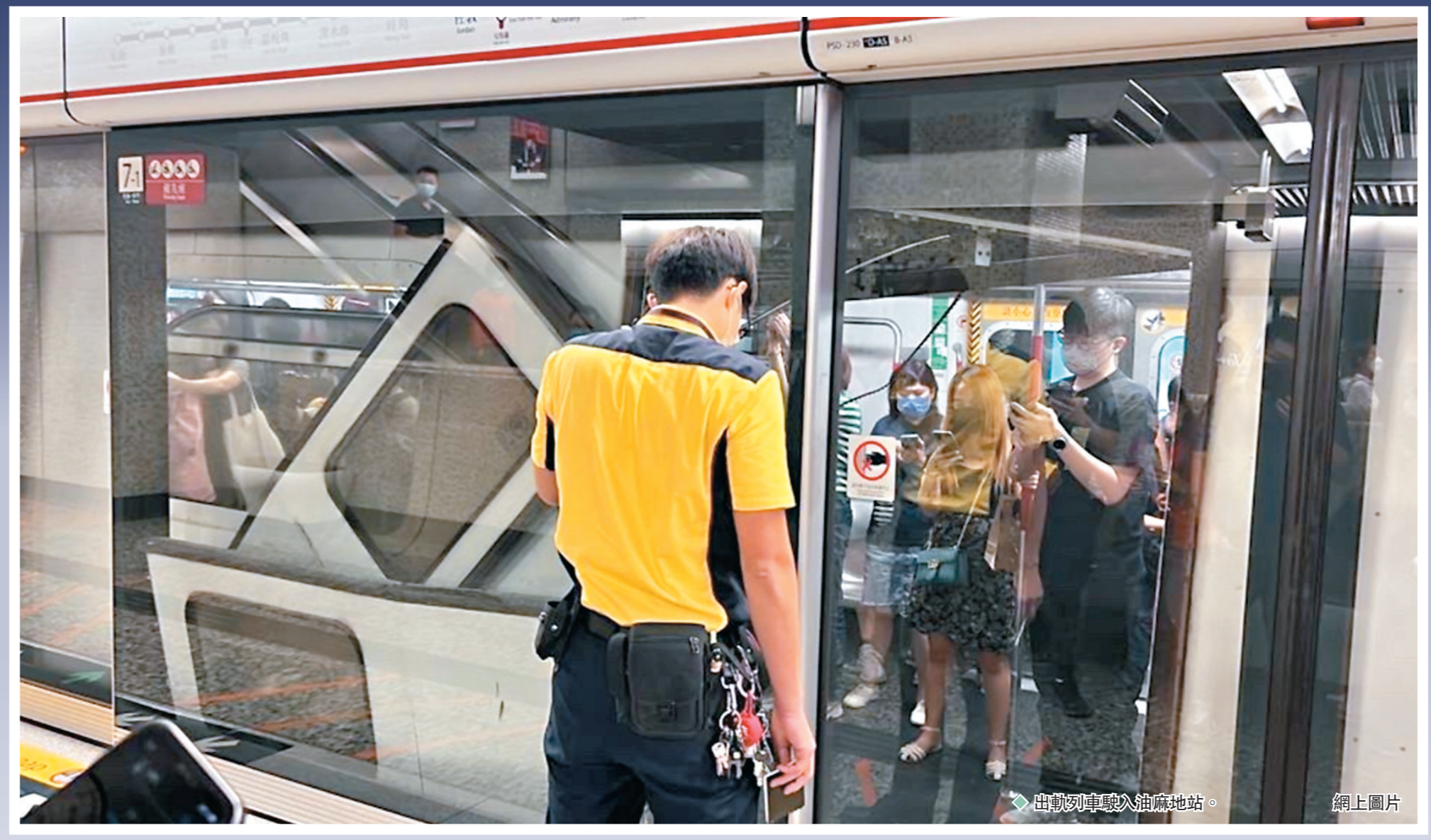
出軌列車駛入油麻地站。

事發昨晨約9時30分，荃灣線往中環方向一輛列車駛入油麻地站時，車長驚聞異響，立即制車，當列車停時，有兩卡車廂已進入月台，惟第一卡車廂有兩道車門甩脫，並與月台幕門發生碰撞，一度冒煙。車長立即通知車務控制中心啟動處理程序，包括報警及暫停荃灣線來往荔景至佐敦的列車服務。