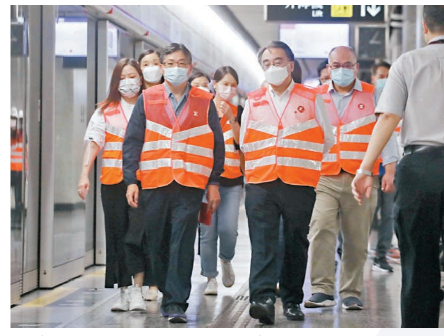
◆運輸及物流局局長林世雄（前左一）等到油麻地站巡視維修進度。

港鐵事故後首先在佐敦、荔景、太子設置接駁巴士站，其中在志和街對開的接駁點，港鐵職員拉起圍欄安排乘客排隊，人龍連綿不絕，高峰時有逾百人「打蛇餅」排隊，港鐵職員不時提醒乘客守秩序。有港鐵職員直言：「非常忙碌，公司有送食物，但成朝都未食過嘢。」 由於港鐵安排的接駁巴士並非沿途站站上可落，例如深水埗站只供乘客落車，有乘客唯有改坐巴士，令巴士站大排長龍。直至傍晚，港鐵才作出改善，在南昌、荔枝角、長沙灣及深水埗站都可上車。有深水埗市民表示，昨在巴士站等車的人較平日多了三四倍，令候車時間要多半小時。