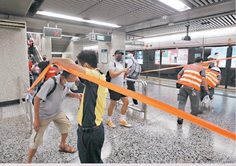
◆港鐵職員拉起封鎖線，禁止乘客靠近。

受港鐵列車在油麻地站出軌「鬼門」事故影響，油麻地站大批乘客要疏散，荃灣線月台更受臨時封閉，大批乘客受影響。有乘客批評港鐵指示混亂換來一肚氣，直呼：「唔知港鐵發生咩事？」一名黃姓女乘客由何文田站上車，到油麻地站後轉車準備到葵興，詎料登車後卻聽到廣播要求離開車廂，且未解釋原因。當她與其他乘客返回月台後再排隊等候下一班車時，過了約10分鐘才有職員表示沒有車，令乘客無辜等等。