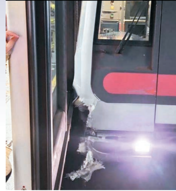
▲列車出軌後車頭撞毀。