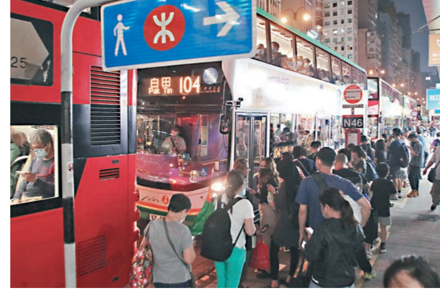
◆彌敦道沿線巴士大排長龍。