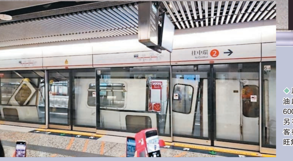
鬼門列車在油麻地站疏散600名乘客，另有150名乘客從車尾步往旺角站。網上圖片