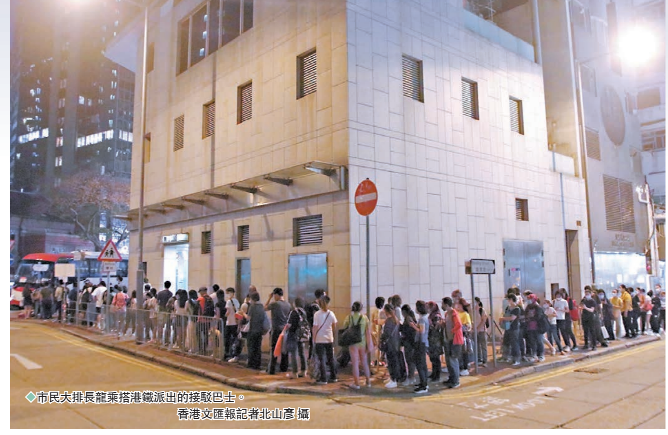
◆市民大排長龍乘搭港鐵派出的接駁巴士。