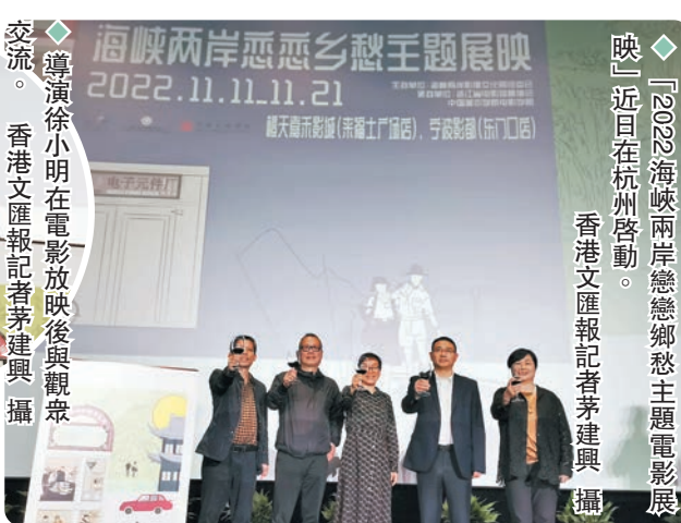
導演徐小明在電影放映後與觀眾交流。

本次活動展映從11月11日起持續至11月21日，8部海峽兩岸電影人的佳作與影迷見面。台灣影評人肥內和詩人、製片人沈偉也在《戀戀風塵》映後與觀眾進行分享和深入的交流。