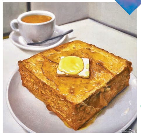
◆歐陽國健《四季平安》