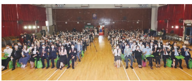
◆全場大合照，場面溫馨熱鬧。

教育局局長蔡若蓮致辭時指出，鐘聲慈善社於1915年成立，植根香港一個世紀有餘，是多元慈善團體，對香港貢獻良多。而鐘聲慈善社胡陳金枝中學全副心全意服務區內青少年，為莘莘學子提供優質教育，引導同學建立正確的人生觀、價值觀，幫助他們全面發展，充分發揮個人潛能，使其熱愛國家、熱愛學校、熱愛家庭，學校的成績有目共睹。她呼籲要更加多關心、關愛青年人，因為青年興，則香港興；青年發展，則香港發展；青年有未來，則香港有未來。還要