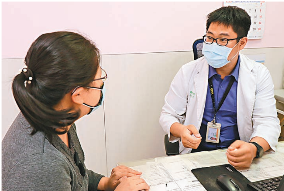
◆年輕女子如遇卵巢儲備功能減退信號，要及早檢查。

近年，都市壓力愈來愈大，尤其中青年女性要留意，近日為一位35歲已絕經的病人作中醫調理。雖說是一個毫無希望的病人，但是我們還是對她進行一系列的治療，中醫認為腎主生殖，腎中精氣充盈，天癸成熟，月經按時來潮；腎中精氣衰退，天癸耗竭，月經閉絕，天癸為腎陰，也叫元陰、真陰、腎水，為腎精所化，卵也是腎精，是形成胚胎最原始的物質，結合現代醫學，卵巢中卵泡數量少，質量差，叫卵巢儲備功能減退，有發展為卵巢早衰的可能，其病機是腎精不足、腎陰血虧虛。中醫自古以來並無「卵巢儲備功能減退」的病名，根據患者表現出月經失調甚至閉經、不孕及烘熱、潮熱、出汗等圍絕經期綜合徵的症狀，屬中醫學中「年未老經先斷」、「閉經」、「血枯」、「不孕」等範疇，所以就算以為自己還年輕，也不能忽視「卵巢儲備功能減退」的問題。