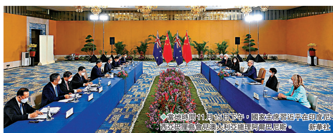
◆當地時間11月15日下午，國家主席習近平在印度尼西亞巴厘島會見澳大利亞總理阿爾巴尼斯。