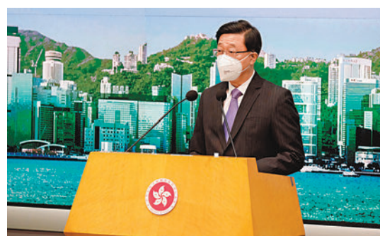
◆特首李家超表示，不再討論「零加幾」，但在風險可控下盡量減少限制。香港文匯報記者涂六攝

另外，旅遊局最新數字顯示，上月訪港旅客初步數字為約8萬人次，較9月份的6.6萬人次上升22%，當中非內地旅客由9月份的14,761人次升至10月份的32,866人次，增幅達1.2倍。旅遊局表