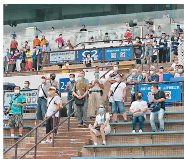
◆特區政府宣布，明天(17日)起放寬部分防疫措施，包括馬場室外範圍准許恢復飲食。資料圖片