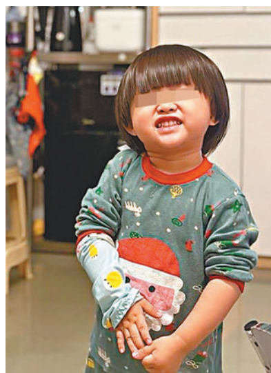
◆欣欣出院後活潑可愛。

他表示，冬季流感高峰期將至，家長應盡快帶子女接種新冠疫苗及流感疫苗，避免子女在新冠病毒和流感雙重夾擊下增加風險，「如果一齊被(兩病毒)入侵，情況會令人驚恐，出現嚴重情況的幾率會變大，曾見過同時患有新冠及流感的兒童，症狀是特別厲害的。」