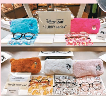
◆Disney Furry Collection created by Zoff

人氣日本眼鏡品牌 Zoff 進駐香港 5 周年，同步迎來限定周年祭大抽獎。今年，品牌更進駐沙田新城市廣場開設第 14 間分店，新店集合全港最多兒童眼鏡款式，同場更推出 15 歲或以下小童免費升級防藍光鏡片優惠，好好保護小朋友的眼睛！同場亦可搶先預覽新登場的「Disney Furry Collection created by Zoff」，輕飄飄、毛茸茸，可愛得令人無法抗拒！以迪士尼和彼思的毛茸茸角色為靈感，設計出讓你感到溫暖的鏡框、毛茸茸的眼鏡袋和眼鏡布等一系列產品。當中包括「小姐與流氓」的小姐、101 斑點狗、「富貴貓」的瑪麗、「怪獸公司」的毛毛和「反斗奇兵」的勞蘇一共 5 款。CLASSIC 亦於今個冬天推出寶石型復古設計的「Zoff CLASSIC WINTER VINTAGE」系列，復古眼鏡以現代的方法重新詮釋，尺寸恰到好處，是近年大熱的款式。