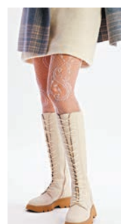
◆Tie Knee Boot

不論靴子還是平底鞋，今季都大玩色彩與圖案，從緋紅色到亮銀色；從動物花紋到復古格紋，都能展現你強烈的個性。今季品牌的長靴款式五花八門，如 Tie Knee Boot 主打貼腳和厚底的款式，從鞋帶款式到簡潔的鞋面任你選擇，柔軟的羊皮或毛絨內裏溫暖舒適，而防滑鞋底則令你的步履更輕盈。