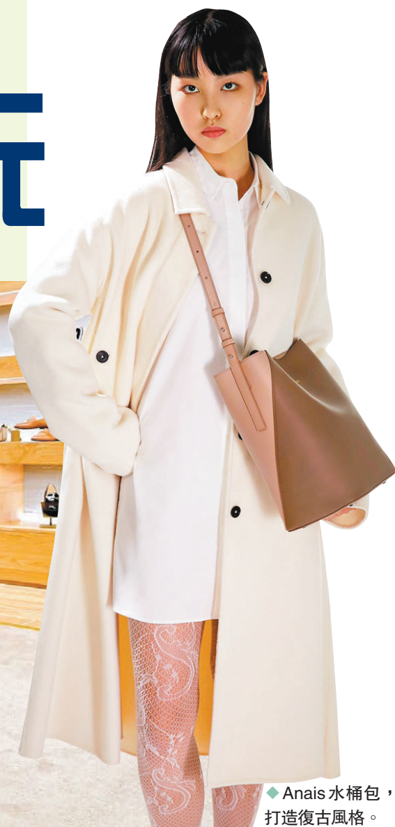
◆Anais水桶包，打造復古風格。