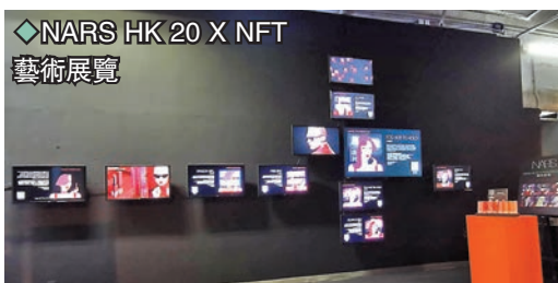
◆NARS HK 20 X NFT 藝術展覽

POWERICON NFT 賦予不同面型、飾物、髮型、服飾、唇色等特徵構成。展場內全息投影在房間內螢幕上，大家可第一身體驗 POWERICON NFT 元宇宙資產概念。同時，大家可發掘更多品牌產品故事、彩妝教學及指導，NFT 持有者更可獨家獲邀參加 11 至 12 月的 Artistry Hour 星級彩妝指導，優先預覽品牌最新系列。