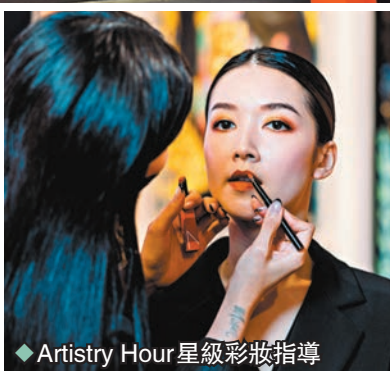
◆Artistry Hour 星級彩妝指導