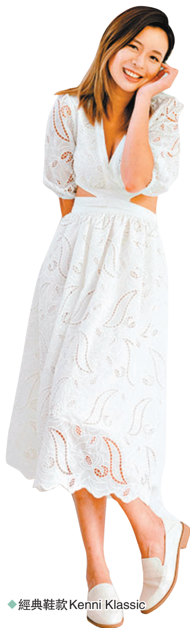
◆經典鞋款 Kenni Klassic