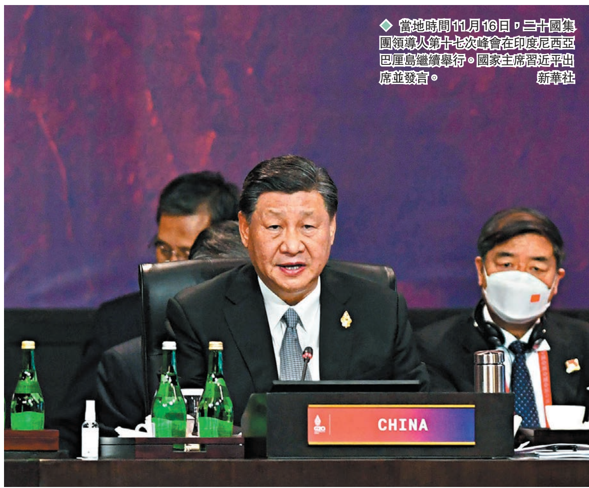
◆當地時間11月16日，二十國集團領導人第十七次峰會在印度尼西亞巴厘島繼續舉行。國家主席習近平出席並發言。