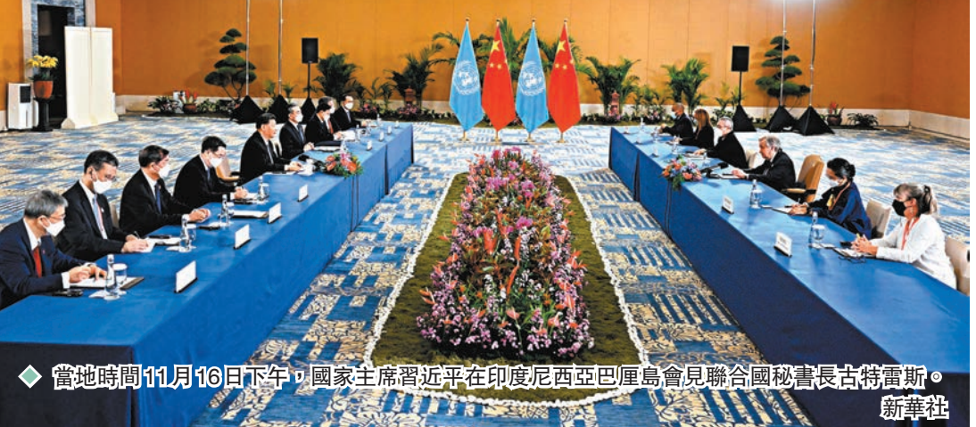
◆當地時間11月16日下午，國家主席習近平在印度尼西亞巴厘島會見聯合國秘書長古特雷斯。

宋偉分析，真正的多邊主義應該是在以聯合國框架為核心的多邊平台上進行的多邊對話和合作，尊重現有的國際法準則和多邊國際制度，而不是另起爐灶。他說，二十國集團峰會制度也是對聯合國體系的補充而不是代替，為的是讓多邊合作更有效率。通過聚焦於提升現有聯合國體系的效率和公平，可以最大限度凝聚國際社會的共識，減少全球治理的制度成本。 ◆香港文匯報記者 葛沖 北京報道