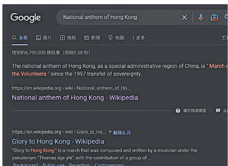
香港文匯報記者昨晚嘗試在 Google 搜尋「National anthem of Hong Kong (香港國歌)」，結果前排卻出現「港獨」歌曲連結。網上截圖

他建議特區政府安排人員為國歌等市民關注的重要資訊，在 Wikipedia 建立官方認證的條目，並關注虛假資訊，積極作出反對及更正，及安排搜尋引擎優化 (SEO) 人員做好優化政府網頁搜尋結果的工作等。