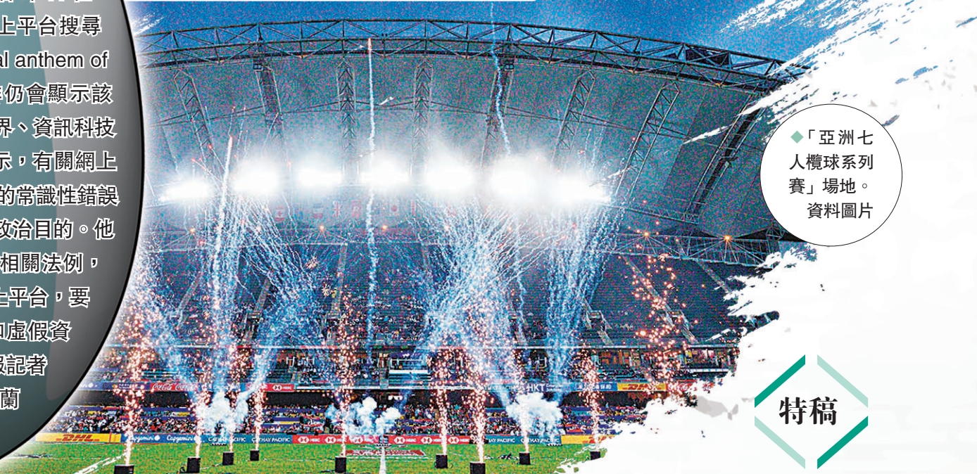
「亞洲七人欖球系列賽」場地。資料圖片