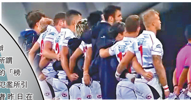
韓國仁川舉行「亞洲七人欖球系列賽」，香港隊與韓國隊進行決賽，賽前主辦方在演奏中國國歌時，竟錯誤播出「港獨」歌曲。資料圖片

亞洲七欖比賽日前在韓國舉行，主辦方在港隊作賽前播出了「獨」歌。主辦方聲稱，是一名實習生在網上搜索所謂「香港國歌」時，下載了搜索結果的「榜首」導致，令人關注到網上失實資訊氾濫所引發的種種問題。香港文匯報記者昨日在 Google、Wikipedia 及 YouTube 等網上平台搜尋關鍵字「香港國歌」或英文「National anthem of Hong Kong」，搜尋結果的首頁前排仍會顯示該「港獨」歌曲的連結及資訊。多位政界、資訊科技界人士在接受香港文匯報訪問時表示，有關網上平台有義務維護事實，如今對明顯的常識性錯誤視而不見，令人質疑有關做法有政治目的。他們要求特區政府完善數據安全相關法例，執法部門亦應主動聯絡各網上平台，要求對方立即將涉嫌違法和虛假資訊下架。香港文匯報記者 黃書蘭