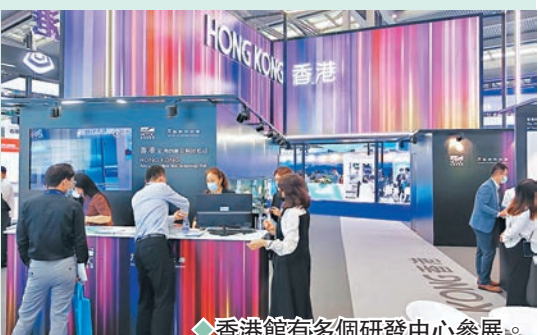
◆香港館有四個研發中心參展。

此次高交會，他認為，香港眾多參展企業可以把研究發展成果變成一個產品和進行市場推廣。港企憑藉粵港澳大灣區建設帶來的機遇，以及聯繫全球商業網絡，加上政府提供的配套支持，具備優越條件研發及創新，成為未來經濟發展的重要動力。