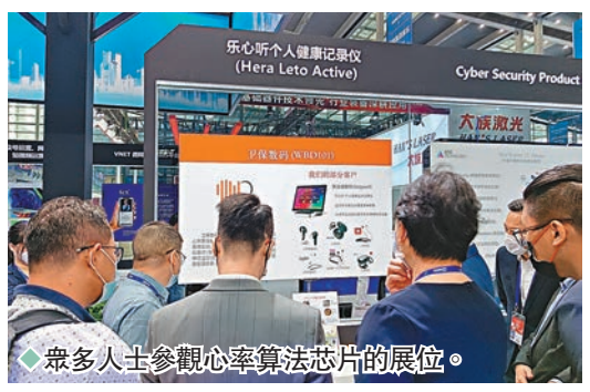
◆眾人參觀心算率算法芯片的展位。

香港文匯報訊（記者 李昌鴻 深圳報導）在此次高交會上，港企衛保數碼展館負責人賀先生表示，公司主要做人體生理傳輸的監測技術，在香港研發的心算率算法芯片，顧客通過佩戴耳機，可以提供高精度的人體數據，包括動態心率、血氧、核心體溫、呼吸率、焦慮、心肺功能、心率恢復率、靜止心率、動態數據以至打鼾鼾聲等。