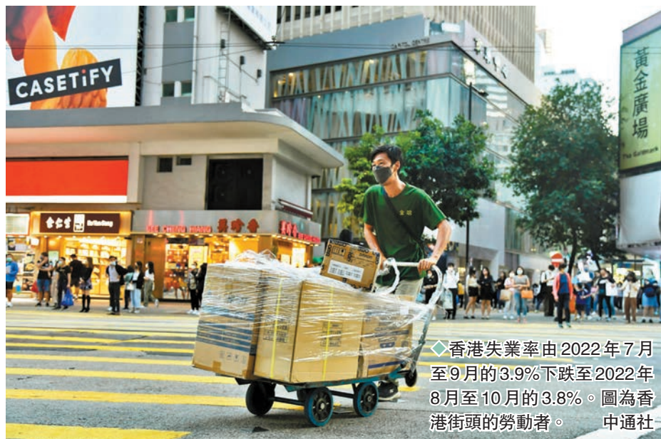
◆香港失業率由2022年7月至9月的3.9%下跌至2022年8月至10月的3.8%。圖為香港街頭的勞動者。

勞工處將於本月24日及25日在修頓場館舉辦「共創多元文化工作間招聘會」，共有逾40個僱主參與並提供大量不同行業的職位空缺。而勞工處於今年8至10月