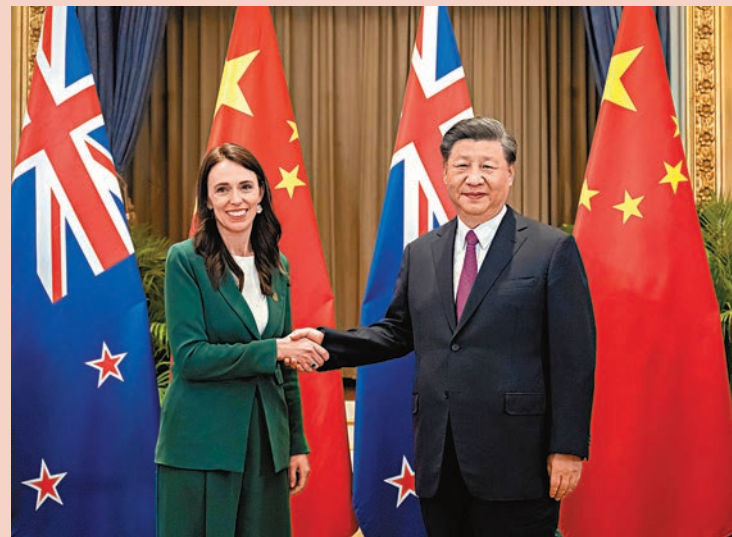
◆當地時間11月18日下午，國家主席習近平在泰國曼谷會見新西蘭總理阿德恩。

阿德恩表示，新西蘭人民迄今對習近平主席2014年訪新情景記憶猶新，我對2019年訪華期間同習近平主席進行會見也記憶猶新。中新兩國友好交往源遠流長。儘管受到新冠肺炎疫情影響，雙方關係依然保持強勁發展勢頭。雙方應該以今年中新建交50周年為契機，認真總結