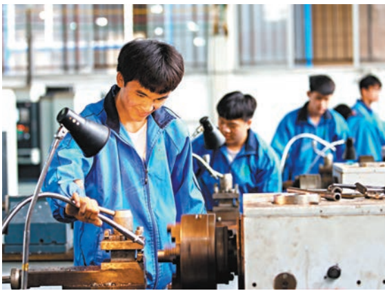
◆教育板塊連升三周，本周漲幅達9%。圖為學生在實驗室加工軸類零件。

教育部等五部門近日印發《職業學校辦學條件達標工程實施方案》，要求各地統籌區域職業教育資源，結合區域經濟社會發展需求，優化職業學校布局，合理確定招生規