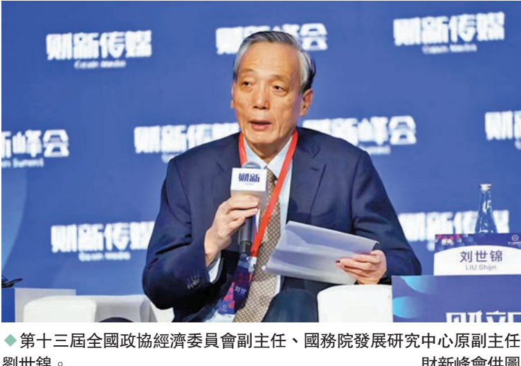
◆第十三屆全國政協經濟委員會副主任、國務院發展研究中心原副主任劉世錦。

今年以來中國經濟增速低於預期，第十三屆全國政協經濟委員會副主任、國務院發展研究中心原副主任劉世錦昨日出席第十三屆財新峰會時表示，新冠疫情三年來，中國經濟實際增速持續低於潛在增長率，這種情況不能再持續下去了。隨著近期優化防疫政策「20條」、房地產金融「16條」、推動平台經濟發展等政策出台和落地，中國經濟恢復的有利條件在增加，建議2023年政府應提出不低於5%的增長目標。 ◆香港文匯報記者 海巖 北京報道