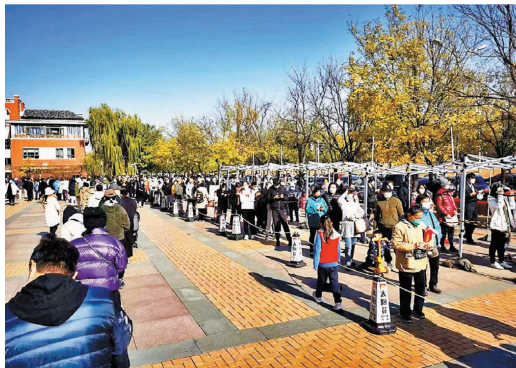
◆排起長隊等待核酸檢測的北京市民。

北京市委宣傳部副部長徐和建介紹，當前北京市疫情呈現多點面增長態勢，社會面隱匿傳播風險持續增加。「本輪奧密克戎變異株傳染性強、隱匿性強、潛伏期短，個人防疫千萬不能麻痹大意，請市民一定增強防護意識，尤其是抵抗力較低的老人和兒童，非必要不前往人員密集場所。」北京朝陽區副區長楊蓓蓓表示，19日新劃定的高風險區域和風險點位將通過北京朝陽區官方平台和媒體進行發布，請市民朋友們密切關注，如有交集立即主動向所在居住地報告。她提示，朝陽區除劃定的高風險區外，全域劃為低風險區，並倡議朝陽區市民周末「宅一宅」。「今天，馬路上車流少了，公共場所人流少了。也希望大家明天繼續『宅一宅』，居家休息，減少外出，非必要不離開本區域，不聚會、不聚餐、不串門，主動進行核酸檢測，做好個人防護，戴口罩、勤洗手，保持安全社交距離。」