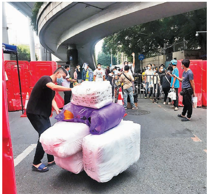
◆即便是在重點管控地區，居民仍可通過網購購買生活物資。圖為專門人員將生活物資送到海珠區管控區。