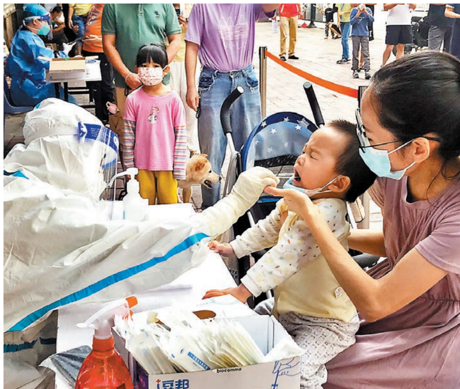
◆19日，廣州各區繼續開展全員核酸篩查，篩查結果將作為後續推出細化措施的參考。

香港文匯報訊（記者 敖敏輝 廣州報道）香港文匯報記者19日從廣州市疫情防控發布會上獲悉，18日全天，廣州新增8,713宗新冠肺炎本土感染者，比前一個統計日減少531宗，這也是本輪疫情以來，新增感染者首次有明顯下降。廣州市衛健委表示，目前，白雲、黃埔等6個區疫情傳播鏈已經阻斷，荔灣、天河、番禺3區亦趨穩定。目前，廣州通過精準劃分高風險區、有序解除管控區等措施，加速推動生產、生活恢復正常，其中，在海珠區，與市民生活息息相關的農貿市場，已有超過六成恢復開放。不過，疾控部門表示，雖然傳播指數下降，但海珠區社區傳播風險仍未阻斷，新增感染者仍然高企，疫情防控形勢依然複雜嚴峻。