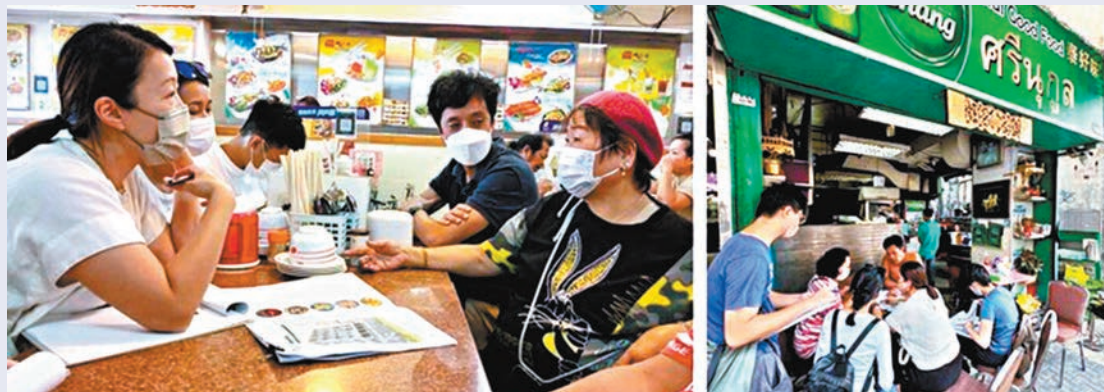
◆團隊走訪區內不同食肆（左），包括一些泰國餐館（右），與經營者深入訪談。

市建局行政總監韋志成昨日發表網誌指出，市建局近年以「規劃主導」取代「項目主導」，於大範圍舊區透過重新規劃，大規模改善已建設環境，增加市區更新的社會效益。他表示，市建局最近更於「龍城區」的重建計劃範圍以試點模式推行「融合策略」的更新工作，着力提升地區環境和打通新舊區連接，同時透過試行「小區復修」先導計劃，鼓勵業主做好樓宇公用地方和單位內部維修保養；以及透過保育和活化工作，促進新舊建設環境的融合。