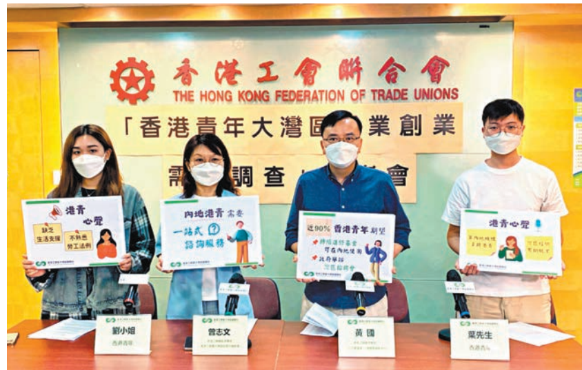
◆調查顯示，近95%的內地港青滿意灣區內地城市工作及生活。

特區政府的「大灣區青年就業計劃」於2021年推出，吸引400多間企業合共提供近3,500個職位空缺，逾1,000名畢業生入職。這份名為「香港青年大灣區就業創業需求調查問卷」於10月24日至11月4日進行，共回收220份問卷，包括161名內地港青，59名在港青年，受訪年齡介乎18至45歲。