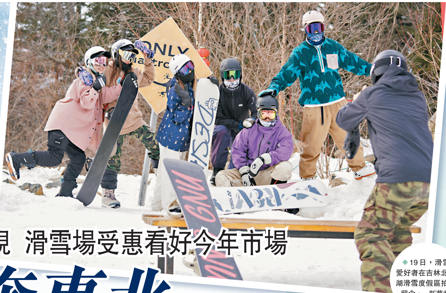
◆19日，滑雪愛好者在吉林北大湖滑雪度假區拍照留念。