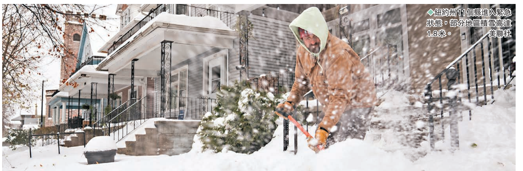
◆紐約州11個縣進入緊急狀態，部分地區積雪高達1.8米。

密歇根、印第安納及賓夕法尼亞州部分地區也出現積雪。密歇根州警方說，該州西南部一處公路發生20至25輛汽車連環相撞事故，幸好沒有人嚴重受傷。警方在社交媒體警告「道路仍然結冰，泥濘不堪，民眾開車必須放慢速度」。印第安納州據報有一名鏟雪車司機意外身亡。◆綜合報道