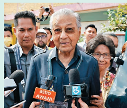
◆馬哈蒂爾在選前表示，若他輸掉此次大選，便會退出政壇。

詹運豪認為，外界對馬哈蒂爾的看法分歧，一方面，他在第一次擔任首相任內的貢獻，使他備受尊崇，但也有人認為他回鍋擔任總理是「很大的錯誤」。2018年大選，馬哈蒂爾領導的改革派「希望聯盟」以壓倒性優勢擊敗執政聯盟國陣，創下馬來西亞獨立以來的首次政黨輪替；但馬哈蒂爾上台後，未依約將總理一職讓渡給安華，隨後因內訌而導致希望政府在2020年垮台。分析家指出，馬來西亞民眾還沒原諒這件事。◆綜合報道