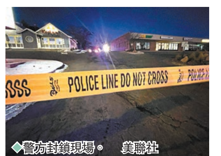
◆警方封鎖現場。美聯社

警方發言人卡斯特羅表示，警方在前晚午夜時分接報，指Club Q發生槍擊案，警員在現場拘捕疑犯，他已被送院治療，警方透露槍手使用長步槍行兇。Club Q事後在Facebook發文，對發生槍擊事件感到震驚，並感謝有客人表現英勇，迅速制伏槍手，結束這場襲擊。◆法新社/路透社