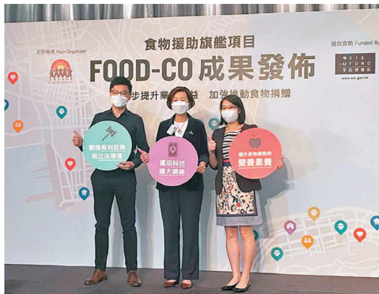
▲調查指逾六成受訪低收入家庭沒足夠能力或金錢購買食物。 ▲市民正排隊領取食物援助。

香港社福界近年來積極提倡「食物銀行」計劃，藉由慈善團體來號召熱心人士提供緊急及短暫的膳食援助。社會創新及創業發展基金(社創基金)自2016年起，透過資助FOOD-CO平台，透過利用科技，再配合跨界別協作，令食肆等企業捐贈的物資更快分派到有需要的市民手上。多年來透過項目捐贈和接收的食物逾1,500噸，總值約1.32億元，提供超過1,200萬份餐，平均每日供應的餐數為6,100餐，受惠人數達2,800人。