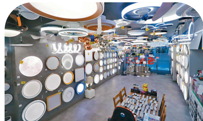
◆燈飾店營業時間都會長期亮着燈飾。