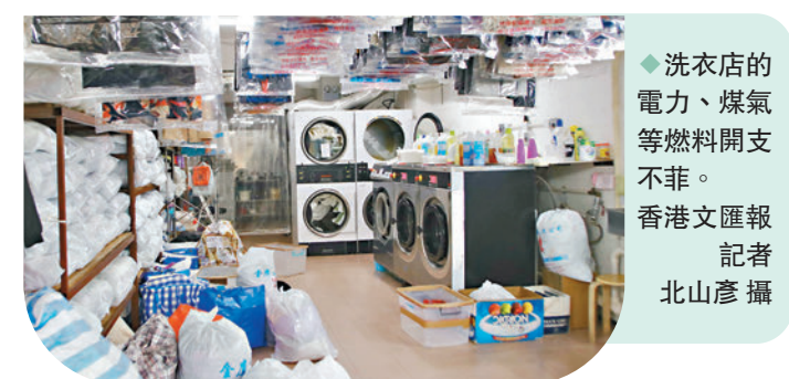
◆洗衣店的電力、煤氣等燃料開支不菲。