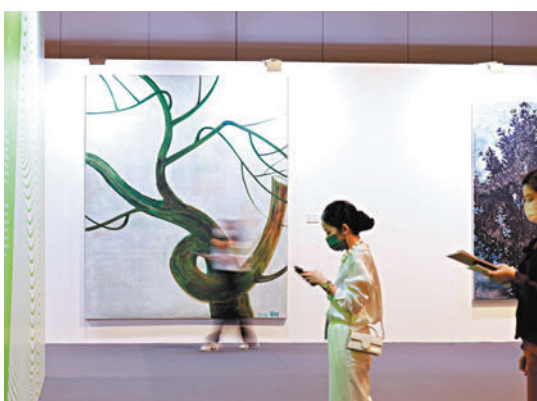
◆展覽策劃獨具匠心，呼應主題。