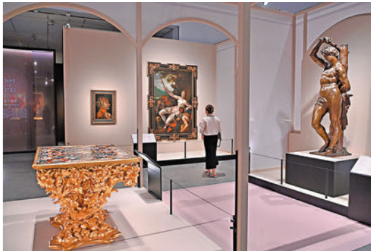
◆「藝苑尋珍——列支敦士登王室收藏名品」展具備全球視野。中新社

藝術品跨越漫長時代，當與現時的公眾面對面時，如何可以更深入地生動「對話」？文物標籤正帶來簡潔卻豐富的資訊，博物館也正步入數碼化時代，他坦言：「在現時的展覽中，我們也運用了一些多媒體元素，希望可以與觀眾有更多互動，當然這些環節還有待提高。我們正在調研觀眾的反應，了解觀眾的需求，為適應本地觀眾的需要而做一些相關的改進和調整，我們未來還會做得更好。」