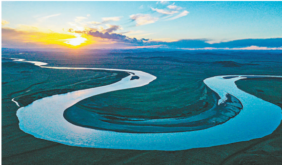
◆黃河九曲第一灣景色得到持續改善。