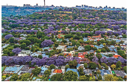
◆在南非約翰內斯堡盛開的藍花楸