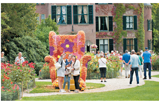
◆荷蘭利瑟的大麗花盛開。

多數國家均有栽植，選育新品種時有問世，據統計，大麗花品種已超過3萬個，是世界上花卉品種最多的物種之一。大麗花花色花形譽名繁多，豐富多彩，是世界名花之一，其花可活血散瘀，有一定的藥用價值。