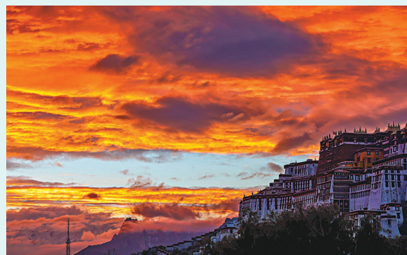
◆從朵森格路方向拍攝的布達拉宮。

拉魯濕地國家級自然保護區內植被類型主要為濕地草甸，植物種類多樣性較高，以高原特有的水生及半水生和草地植物為主；動物種類以水生類為主，脊椎動物種