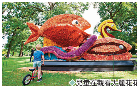
◆兒童在觀看大麗花花車。