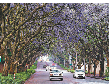
◆車輛穿梭滿布藍花楸的道路

藍花楸是紫葳科、屬落葉喬木，高達15米，葉對生，為2回羽狀複葉，小葉橢圓狀披針形至橢圓狀菱形，花藍色，花序長達30厘米，直徑約18厘米；花萼筒狀，蒴果木質，扁卵圓形，長寬均約5厘米，中部較厚，四周逐漸變薄，不平整。