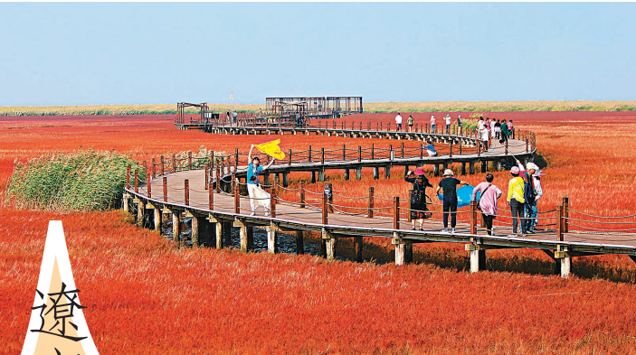
◆遊客在盤錦市紅海灘國家風景廊道景區遊玩。