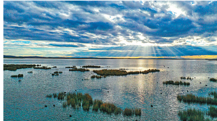
◆在阿壩藏族羌族自治州若爾蓋縣拍攝的花湖濕地。