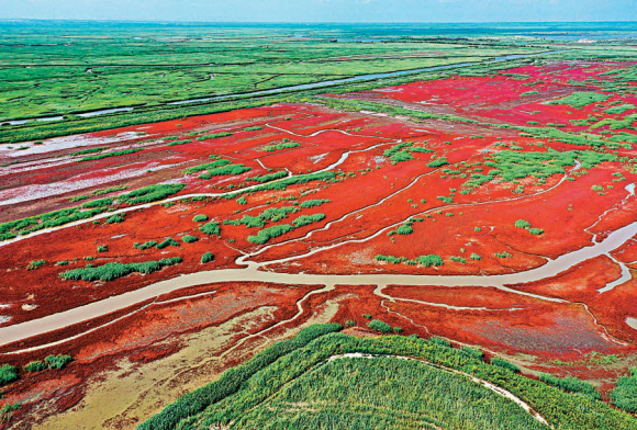
◆遼河入海口旁特有的紅海灘

至於位於盤錦紅海灘濕地旅遊度假區的紅海灘國家風景廊道，是獨一無二的「世界紅色海岸線」，也被稱為「中國最精彩的休閒廊道」和「中國最浪漫的遊憩海岸線」。2020年1月，紅海灘風景廊道被確定為國家5A級旅遊景區。紅海灘4月初為嫩紅，漸次轉深，10月由紅變紫，這裏魚肥蟹美，稻米飄香，海鷗與抽油機為伴，紅海灘與丹頂鶴相映，現代文明與原生文明共生。它左側是旖旎延綿的紅海灘，右側是一望無際的蘆葦蕩，在秋冬時節，它們金紅相映，一路貫通。景區依託紅海灘資源、蘆葦資源、鳥類資源、海河資源、海產品等特色資源，重點突出與自然融合、可持續發展理念，充分利用好紅海灘濕地資源和現有景區內的濱海公路，開發特色旅遊產品。