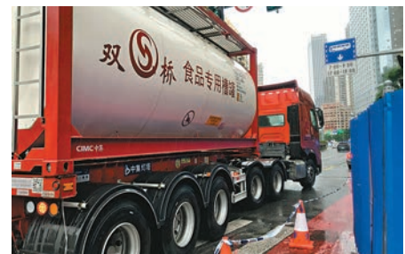
◆24日，多輛食品專用槽罐車，往來海珠區管轄區。

海珠區相關負責人在發布會上表示，近期，海珠區根據全市統一安排，結合當前疫情形勢，迅速制定實施方案，按照「分類施策、科學精準」的原則，規範做好疏