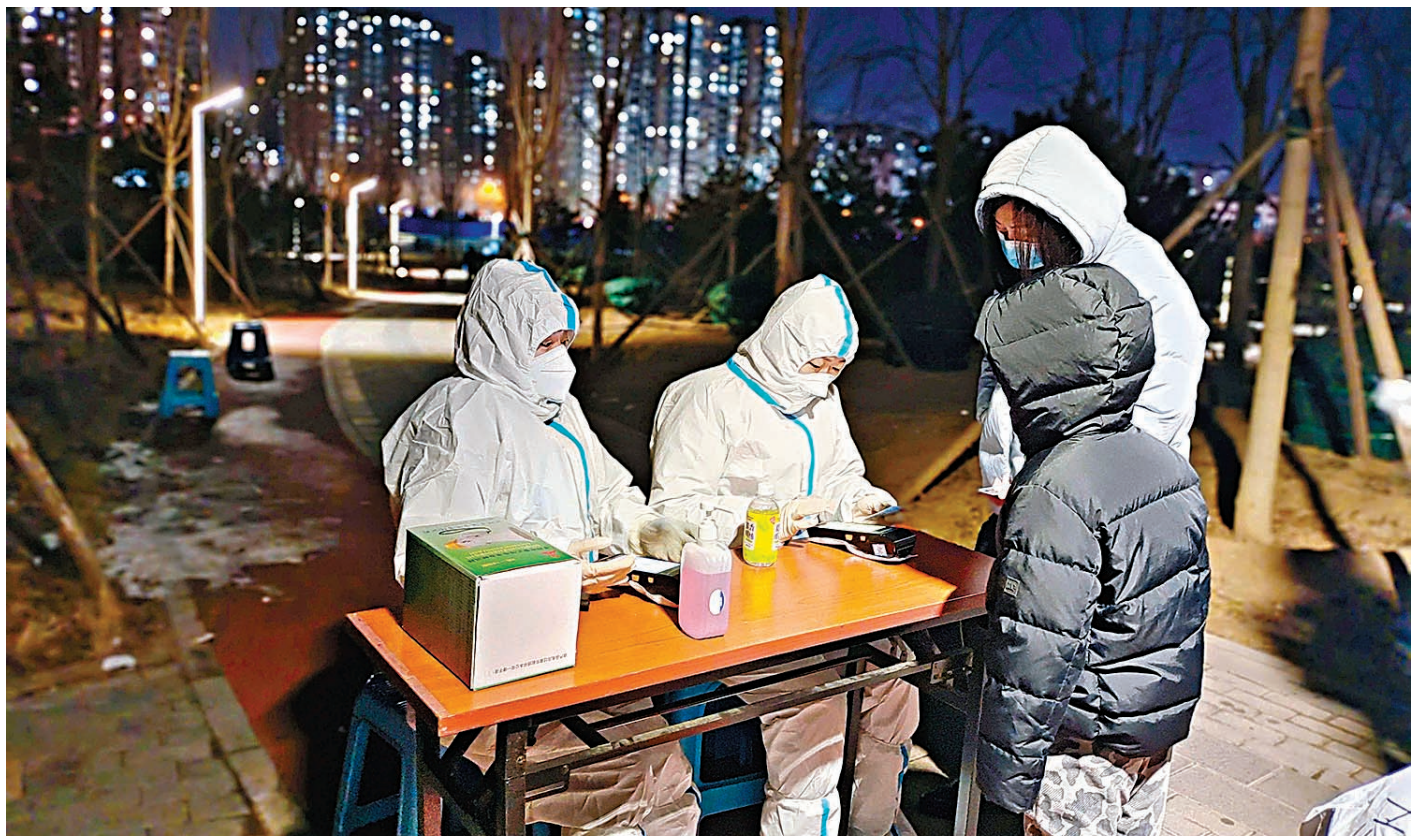
◆為減少核酸檢測過程中的交叉感染，北京部分區域開始啟動核酸自助採樣，有社區要求居民先自測抗原陰性後才能去指定核酸點位做核酸檢測。圖為夜色中北京一處核酸檢測點，工作人員正在查驗登記。

11月20日，「北京通州發布」公布了11月13日以來通州區的風險點位。有媒體查詢發現，在列出的70餘個風險點位中，核酸檢測點和核酸採樣點出現的次數超過30次，除去重複的，有超25個核酸檢測點涉入其中。一位病毒學家表示，逐步採納核酸自採和抗原檢測，是防疫走向科學精準和可持續化的有益嘗試。自採既適用於核酸檢測，也適用於抗原檢測，「相較而言，抗原檢測的優勢更明顯」。這位病毒學家說，儘管中國抗原檢測試劑在全球防疫中發揮了巨大作用，但內地目前還沒有將其充分應用起來，未來應該逐步加強抗原檢測的應用。