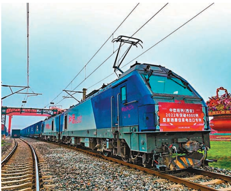
◆由中國鐵路西安局集團開行的首趟中歐班列家電出口專列西安發車。2022年中歐班列長安號開行達到4,067列。

由於中歐班列從中國到歐洲國家，要經過不同國家不同軌距的鐵路，特別是一旦到了各國國境口岸，都要換裝成本國鐵路能運行的列車。此前換裝作業時因為沒有開行時刻表要求和限制，會產生較多無效停留時間，無法做到快速順暢交接。今年10月26日，經過中國國家鐵路集團與中歐班列開行沿線國家鐵路部門磋商溝通，全國首趟境內外全線時刻表中歐班列長安號在西安正式開行，從而通過各規矩鐵路班列時刻表的接續，有效控制了中歐班列各環節作業時間，消除了口岸站辦理列車換裝時的無效停留時間，大大提高了運輸時效。