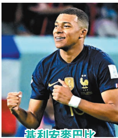
基利安麥巴比 法國前鋒

至於C組波蘭隊對沙特阿拉伯隊(Now616及618台今晚9:00p.m.直播)。前者上輪對墨西哥隊又是顯示無甚板斧，王牌利雲度夫斯基更疑似因壓力射失