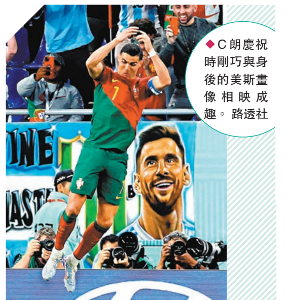
C朗慶祝時剛巧與身後的美斯畫像相映成趣。

加納隊教練艾度對C朗能博得12碼感不滿，認為球證是因倒地的是C朗，才會在沒有明顯身體接觸下仍判12碼：「這12碼根本不應存在，就因為他是C朗才會給12碼，如是其他球員肯定不會判的。」C朗回應時則只表示球證判罰正確，但補充指這只是首場勝利，球隊仍要繼續努力。