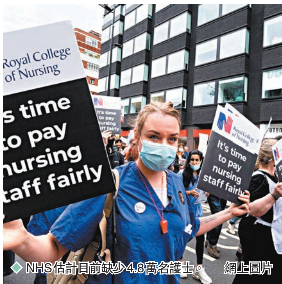
◆NHS估計目前缺少4.8萬名護士。 網上圖片