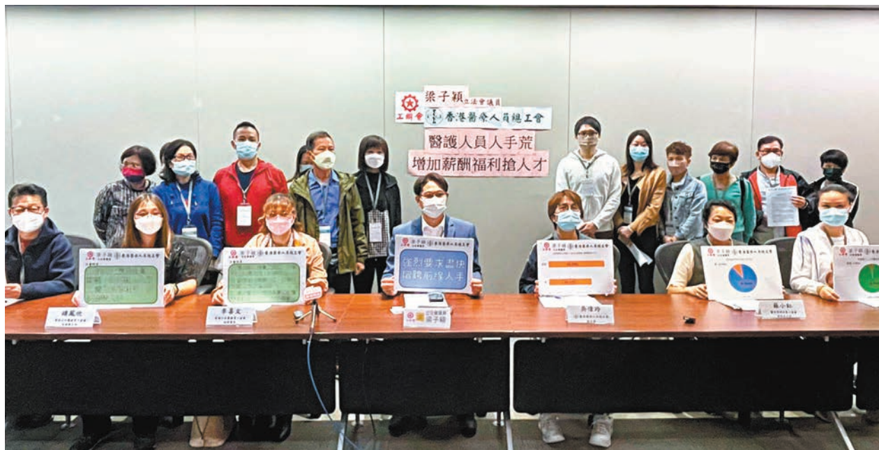
◆調查發現，九成受訪的醫管局前線醫護及支援人員表示所屬部門人手不足。

新冠肺炎疫情反彈，香港醫護以至支援人員工作壓力倍增，經常全天候超負荷運轉，以致身心俱疲。有工會的調查發現，九成受訪的醫管局前線醫護及支援人員表示所屬部門人手不足，更有四成人表示考慮辭職。有前線員工表示，一雙手要負責多個病房的清潔、出院安排等工作，有新入職同事做到「喊」，最終受不了而離職；有員工目擊急症室的病人等了又等，病情惡化為危急，直言公立醫院已瀕臨崩潰。工會促請特區政府及醫管局正視前線醫護及支援人員訴求，改善他們工作待遇，吸引更多人行。