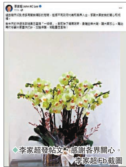
◆李家超發帖文，感謝各界關心。李家超Fb截圖

香港文匯報訊 香港特區行政長官李家超上週日外訪泰國返港，在香港國際機場進行核酸檢測呈陽性。在家隔離6天後，他昨日在社交平台透露，快速測試已呈現「一條線」（即陰性），目前身體除了偶爾會咳嗽外，其他大致無礙，請大家放心，並藉此呼籲市民盡快打針，加強保護，減輕重症風險。