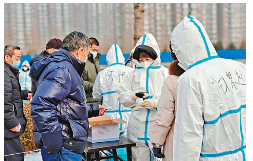
◆北京涉疫街鄉不斷增加，官方呼籲進一步降低通勤率。圖為北京一小區內社區工作者正在組織居民進行核酸檢測。

一是已經出戶下樓在小區內活動滿3天的市民，即日起可以出小區；二是高風險區連續5天內未發現新增感染者降為低風險區域，市民可以出戶下樓。3天內若無新增感染者，可出小區在本區縣內低風險區域有序活動；三是未發現新增感染者不滿連續5天的高風險區，嚴格執行「足不出戶 上門服務」措施；四是可以出小區的個體工商戶，店舖在本區縣內的，允許恢復經營；五是上述措施實施後，經綜合評估排除疫情傳播風險的，可逐步恢復交通，允許跨區縣流動，駕車出行，點對點上班。