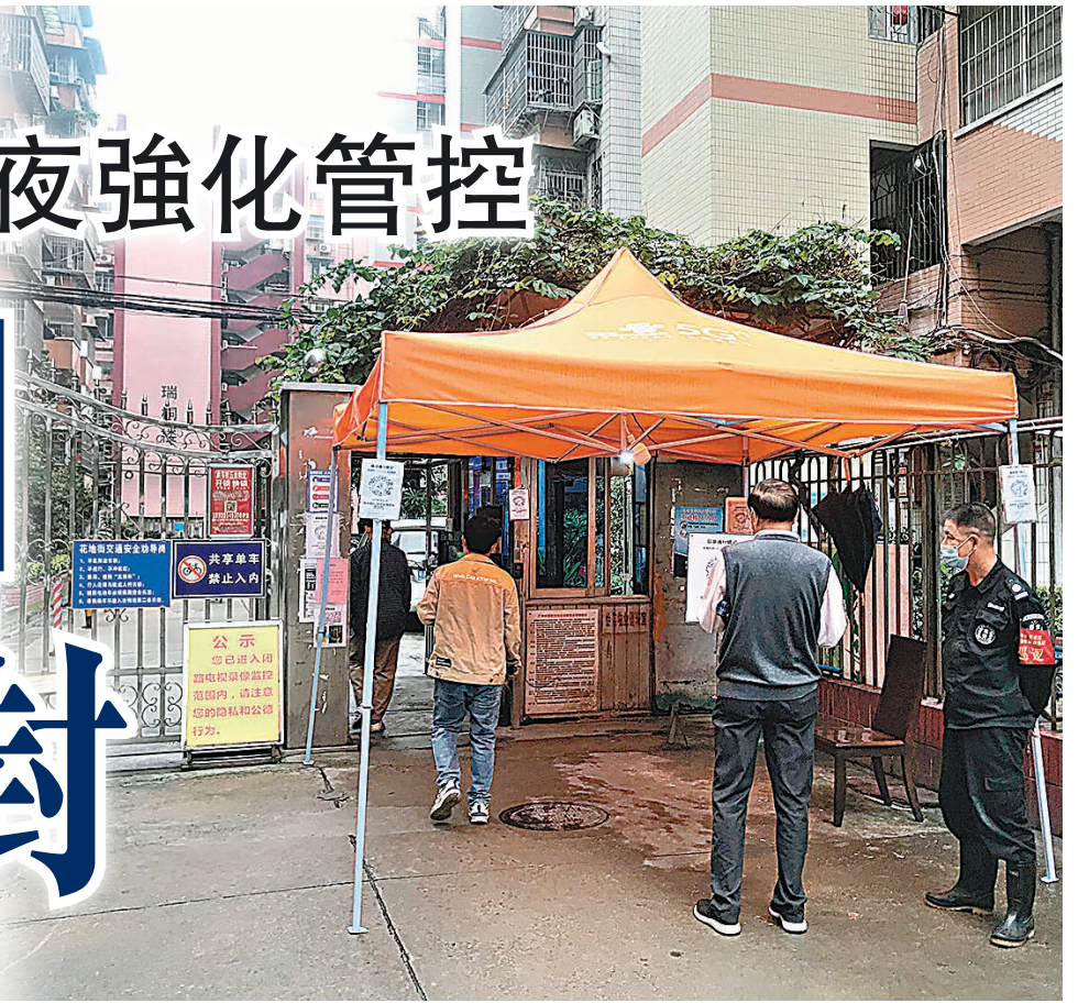
◆管控區內須嚴格執行掃碼、測溫 and 查驗核酸證明等措施。