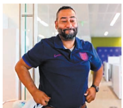
◆片中亞倫穿着英格蘭球衣。 網上圖片