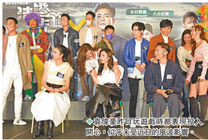
袁偉豪昨同玩遊戲時都表現投入開心，似乎未受近日的風波影響。