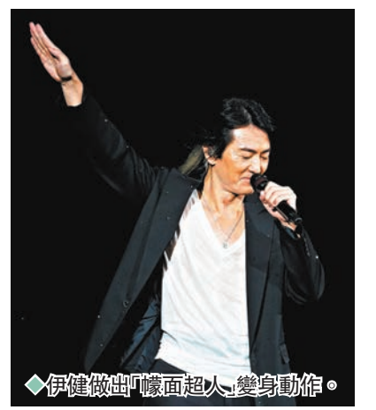
伊健做出「幪面超人」變身動作。