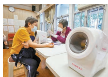
◆檢測篩查結果發現，約40%受試者上臂脈硬度指數超出正常水平。

香港文匯報訊(記者 郭倩)新冠疫情肆虐近三年，市民疫下居家時間較多，令運動時間減少，或有機會增加患心血管疾病的風險。香港社區醫療教育服務協會早前則與深水埗居民聯會及深水埗民政事務處合作，今年5月開始舉辦了約40場心血管硬度檢測篩查，結果發現約40%市民的上臂脈硬度指數(API)偏高，比例亦隨着年齡的增長而增加。