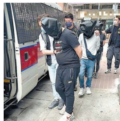
◆警方過去兩周於西九總區展開連串反三合會行動，合共拘捕347人。

警方表示，被捕者中有三合會成員及多名主腦，他們涉及傷人及串謀傷人等罪行。警方重申，打擊三合會活動是警務處處長首要行動目標之一。警方會繼續重點打擊三合會目標人物及其犯罪行為，遏止有關違法活動。