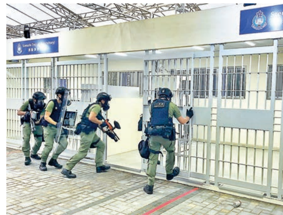
▲圖為入境處示範行動。