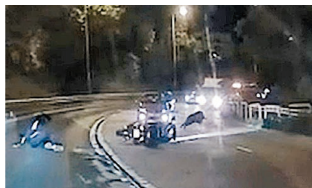
◆野豬撞翻電車後折返原路方向逃入草叢。 網上截圖