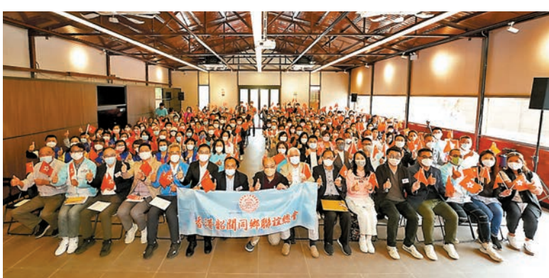
◆香港韶關同鄉聯誼總會等團體昨日合辦「學習二十大會議精神專題講座」，超過200人與會。

香港文匯報訊 香港韶關同鄉聯誼總會、香港韶關同鄉聯誼總會義工團、韶關市港區各級政協委員昨日在流浮山青雲天地合辦「學習二十大會議精神專題講座」。與會嘉賓表示，團結地方愛國愛港力量對香港十分重要，希望大家一同領悟中共二十大報告中的新思想、新部署、新要求，頑強奮鬥、積極向上，為中華民族偉大復興貢獻力量。同時也希望韶關、香港兩地人才加強互動發展，共同建設更美好的中國。