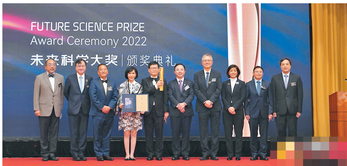
◆「2022未來科學大獎頒獎典禮」昨日於北京、深圳、香港同步舉行。