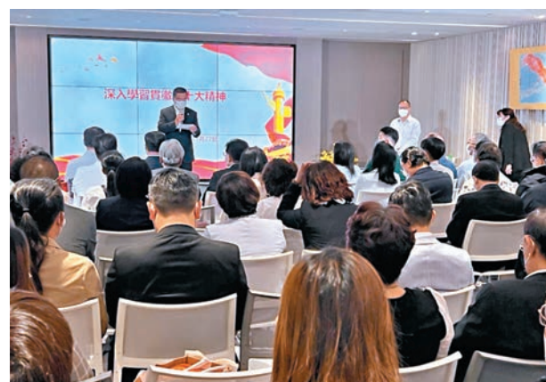
◆近百名同鄉社團代表昨日參與中共二十大精神宣講骨幹培訓。

香港文匯報訊(記者 康敬)中共二十大精神宣講骨幹培訓昨日在港舉行，來自13個省級同鄉社團的近百名代表與會，他們表示，未來將聯繫實際情況、更生活化、日常化地向青年分享二十大報告中帶來的機遇和中共二十大精神，讓更多人了解國家未來的發展規劃，並找到自身的發展方向。