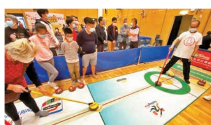
◆小朋友與長者一起試玩地壺球。

香港文匯報訊 觀塘民政處及「精英運動員慈善基金賽馬會動感社區計劃」昨日合辦「觀塘區同樂日」，邀請一眾觀塘區居民體驗各種新型運動，當中包括地壺球、匹克球、圓網球、空手道及劍擊。該計劃旨在以長者、婦女及家庭為主要活動對象，於各區舉辦多個體育活動及講座，鼓勵他們積極參與社區體育活動，達至社區共融。