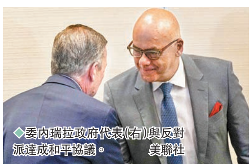
◆委內瑞拉政府代表(右)與反對派達成和平協議。