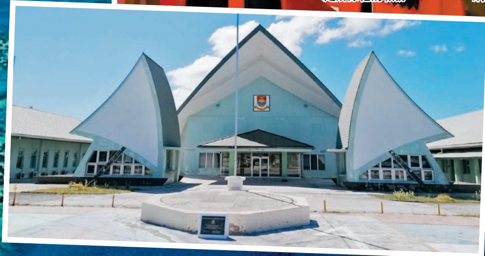
◆太平洋島國紛紛微調司法系統，杜絕「新殖民主義」變遷。圖為基里巴斯議會。