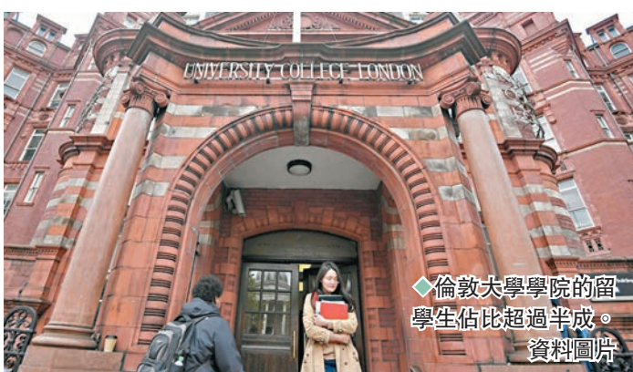
◆倫敦大學學院的留學生佔比超過半數。資料圖片