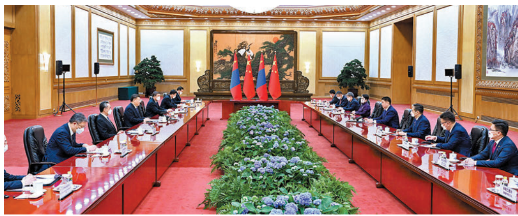
▲11月28日，國家主席習近平在北京人民大會堂同來華進行國事訪問的蒙古國總統呼日勒蘇赫舉行會談。會談前，習近平在人民大會堂北廳為呼日勒蘇赫舉行歡迎儀式。這是習近平和夫人彭麗媛同呼日勒蘇赫和夫人寶勒爾策策格合影。