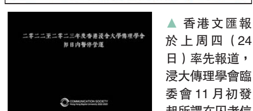
◆昨日浸大傳理學會臨時委員會被校方下令即日停止運作。浸大傳理學會臨時委員會 Fb圖片

活動，鼓吹學生寫信給「政治因素」而選擇判刑囚者。由於該會於租場申請上填寫錯誤資料，涉嫌誤導校方，加上活動引起校內外人士投訴，校方拒絕批出場地，並向部分學會成員展開紀律聆訊並作處分。有關人等其後轉往社交平台繼續宣傳活動，日前更公然發表所謂「理大圍城三周年」帖文，上載一幅極具煽動意味的「V煞」面具黑黑人「佔領」理工大學的畫像，行為令人髮指。