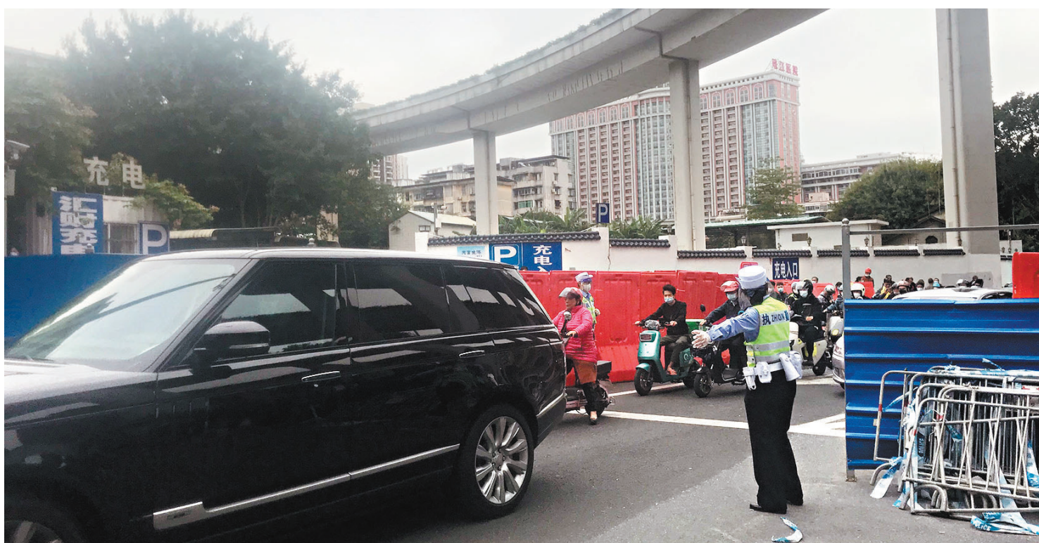
◆11月30日下午，廣州市海珠區、荔灣區、天河區、番禺區、從化區等多區陸續發布通告，解除除高風險區以外的臨時管轄區，而高風險區以單元、樓棟為劃分單位。措施公布後，廣州各大臨時管轄區的圍欄水馬很快拆解，大量市民出行。

河南鄭州也在29日晚間公布，除高風險區外，長期居家老人、每日上網課學生、居家辦公者等無社會面活動人員，如無出行需求，可不核檢核酸。密接接觸者、高風險外溢人員、結束閉環作業的高風險從業人員、入境人員的核酸檢測，按照優化防控工作「二十條」措施執行，重點人員嚴格按照有關規定執行。