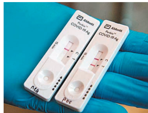
◆ 檢測棒中有兩道線，如果兩道線同時出現，就代表受檢者已感染新冠病毒。

檢測棒中有兩道線，靠下方的一道是測試線，當含有新冠病毒蛋白抗原經過膠體金病毒抗體層，就會被抗體辨認出來，而這第一道線就含有能抓住抗原的抗體，如果受檢者帶有新冠病毒，這條線就會顯露出來。至於第二條線，則有能抓住膠體金抗體分子的抗體，換言之就是在正常情況下必定會顯露出來，所以我們就可以憑這兩條線，看出受檢者有沒有感染新冠病毒，如果檢測棒出現上下兩條線，就是檢測機制運作正常而受檢者呈陽性反應；如果