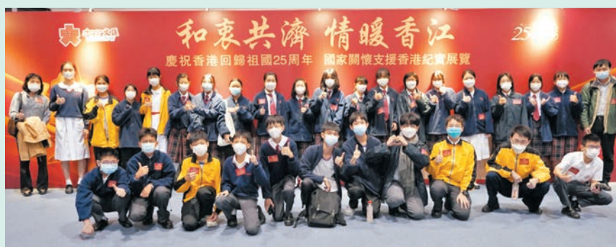
▲東華三院馮黃鳳亭中學逾30位師生參觀展覽。

香港文匯報訊 由香港大公文匯傳媒集團主辦的「和衷共濟 情暖香江——慶祝香港回歸祖國25周年 國家關懷支援香港紀實展覽」昨日進入第二天，繼續吸引香港各界前來會展中心新翼Hall 1A展廳觀展。其中，香港海關助理關長帶領百位新入職海關學員前來參觀