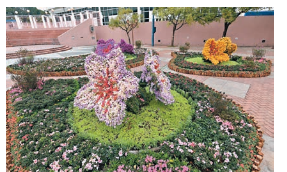
◆2023年香港花卉展覽將於明年3月10日至19日在維多利亞公園舉行。圖為去年位於九龍公園的主題花園。

康文署要求攤位獲許可人及其工作人員須已完成新冠疫苗接種，並在花展開始前24小時內自費進行一次快速抗原測試，其後每3天在進入場地前均需進行快速抗原測試並保留紀錄3天，以便隨時出示供康文署人員檢查。