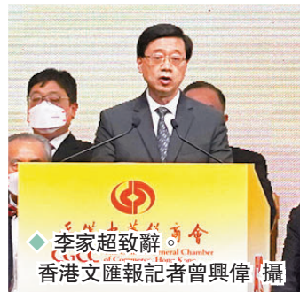
◆李家超致辭。香港文匯報記者曾興偉攝