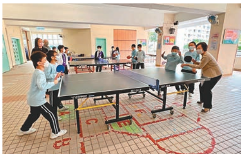
◆蔡若蓮到小學了解學校課堂及午膳安排和運作，又與學生在乒乓球檯上打成一片。

香港文匯報訊（記者 高鈺）受新冠肺炎疫情影响，香港小學生闊別全日面授課近三年，昨日終於再次迎來可全日上課的日子。教育局昨日表示，共接獲259所疫苗接種率達七成的小學全日面授的申請，其中67所於昨日開始，而連同中學，全港已申請恢復全日課的學校有740所。對小一至小三學生來說，首次上全日面授課及在校