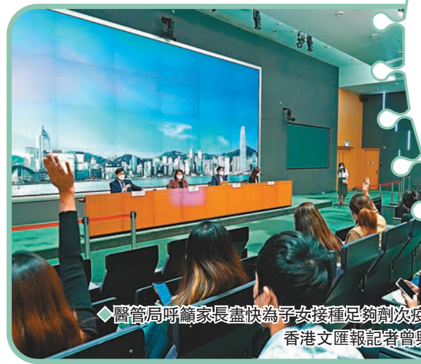
◆醫管局呼籲家長盡快為子女接種足夠劑次疫苗。

她強調：「目前已開始冬季流感高峰期，香港很可能被新冠和流感夾擊，兒童即使現在接種疫苗，亦需兩周以上才能產生足夠抗體，家長莫再猶疑，應盡快帶子女接種新冠和流感疫苗。」