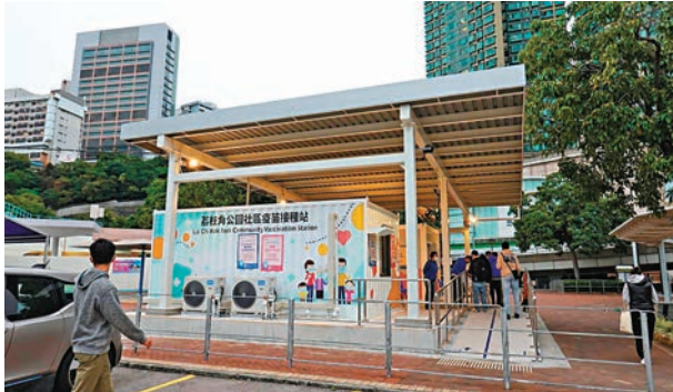
◆荔枝角公園社區疫苗接種站昨日有不少市民接種二價疫苗。

香港文匯報訊（記者 唐文）12歲以上合資格人士由昨日開始可優先接種復必泰二價疫苗作為第四針，公務員事務局局長楊何蓓茵昨日視察首日開打情況時表示，至今約3.12萬人已預約接種二價疫苗，強調接種名額仍然非常充足，呼籲50歲或以上的人士莫遲疑。香港文匯報記者昨日在其中一間社區疫苗接種中心直擊，有市民表示相信科學，所以接種更能防禦變異新冠病毒的二價疫苗，為病毒活躍的冬季做好準備。