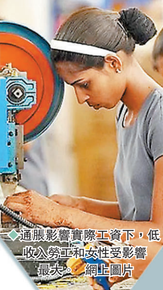
◆ 通脹影響實際工資下，低收入勞工和女性受影響最大。網上圖片