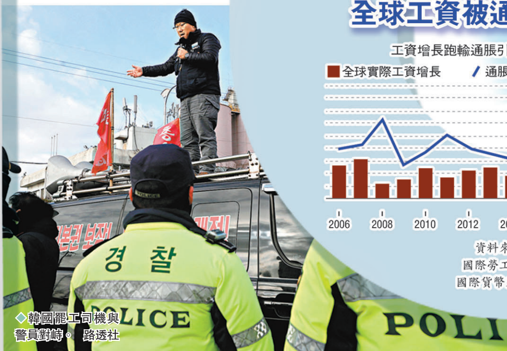
◆ 韓國罷工司機與警員對峙。