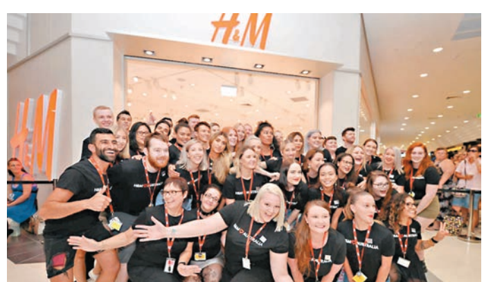
◆ H&M計劃今年減少約165家分店。

美國有線新聞網絡（CNN）則於周二通知員工，表示開始裁員，預計影響數百名員工。今年5月接任行政總裁的利希特在致全體員工備忘錄中稱，裁員是對公司的一次「打擊」，並告訴員工「與CNN團隊任何一名成員說再見都非常困難，更不用說很多人了」。他表示公司前日已通知部分付費撰稿人被解僱，形容媒體企業正受到經濟逆風衝擊，影響廣告收入，CNN必須將這風險納入其長期規劃。