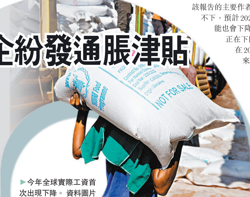
▶ 今年全球實際工資首次出現下降。資料圖片

日本總務省的數據顯示，當地10月份物價按年上漲4.4%。另一方面，日本勞動組合總聯合會發布的2022年春季勞資談判最終統計顯示，統一一調基本工資的平均漲薪率僅為2.07%。無法充分應對目前的物價上漲。 ◆綜合報道