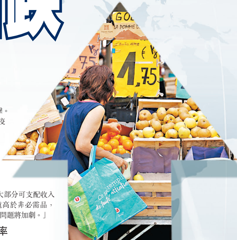
◆ IMF預計今年年底全球通脹率將達到8.8%。

ILO表示，在目前生產率增速超過工資增速的國家，政府可以採取更多措施，保護工人免受生活成本危機衝擊，包括通過強制提高最低工資。認為沒有證據表明薪酬壓力會進一步推高通脹，「在許多國家似乎有提高工資的空間，而不必擔心引發工資連同物價螺旋上升。」ILO還敦促各國決策者向低收入家庭提供優惠券，並下調必需品稅率，以應對通脹加劇。