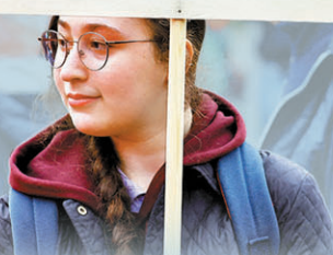
◆ 多地民眾抗議通脹高企。資料圖片