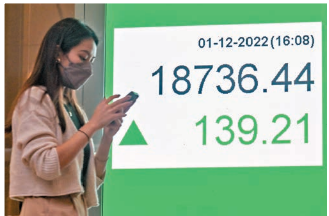
◆聯儲局主席鮑威爾一句說話——「我們認為，在這個時候放慢速度是平衡風險的一個好辦法」，令港股連升三日。