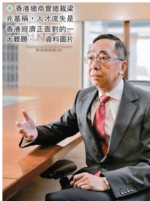
◆香港總商會總裁梁兆基稱，人才流失是香港經濟正面對的一大難題。 資料圖片

另外香港亦會把握數字經濟機遇，與深圳加強合作，當局又將快將推出香港創科技發展藍圖，期望以創科引領，加強經濟動能。