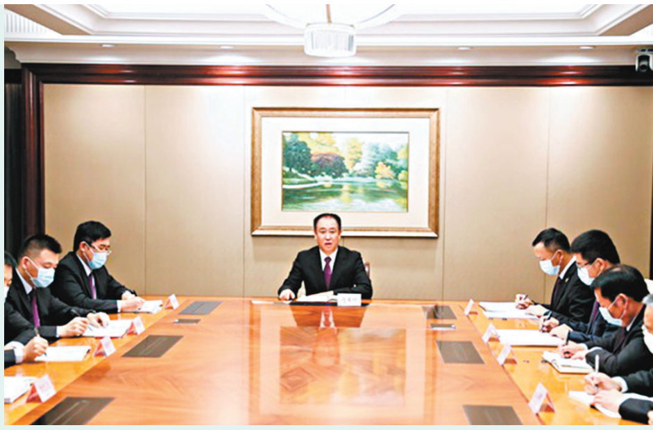
◆恒大集團昨晚發布文章及照片，指集團當日晚間召開保交樓工作專題會議，而許家印有現身出席。

報引述兩名消息人士稱，監管機構已向四大行提供窗口指導，要求在12月10日之前向房企提供以國內資產做擔保的離岸貸款。中行（3988）、建行（0939）、工行（1398）、農行（1288）將分別挑選幾家優質房企，並將在第一批貸款中發放三到四筆貸款。其中一位人士透露，儘管四大行更願意選擇國營房企合作，但它們仍必須選擇一些對此類貸款有更大需求的民營房企，四大行將分別選擇不同的房企以避免發生重合，在第一批試行完成後，還將擴大範圍納入更多銀行。